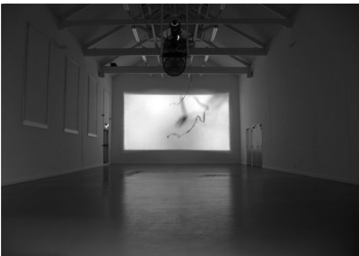
Sine (digital / analog converter, Juliana Borinski & Pierre-Laurent Cassière, 2006 Vue de l'exposition "Borderline Behaviour- Drawn towards Animation", TENT, Rotterdam, The Netherlands 2007

Her site : http://www.julianaborinski.com/