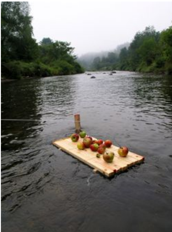
Radeau auto-propulsé Bois, pomme, amarres, 2011 Extrait de pp. 219-220 de Johan van Lengen's "The Barefoot Architect."

Travail récemment réalisé au Vermont Studio Center