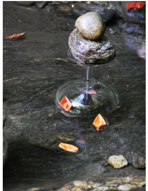
Water Hole terrarium Verre, pierre, bateau en papier, 2011