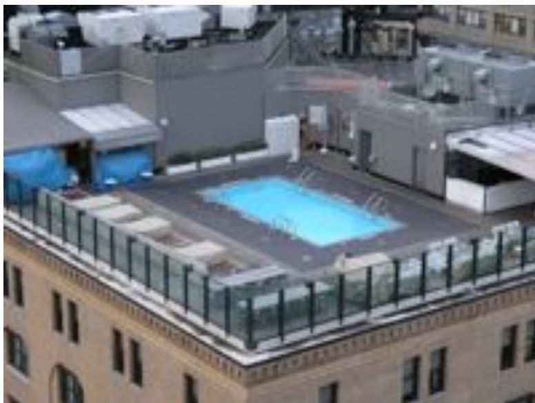
Images visibles au travers du monocle, jointes aux toits des bâtiments.