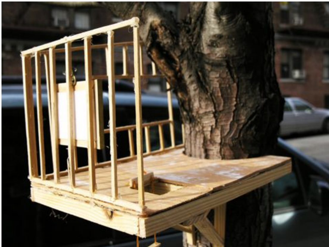
Multiplés vue de cabanes de rues - City Treehouse (sunnyside), une installation sauvage dans New York City, 2010