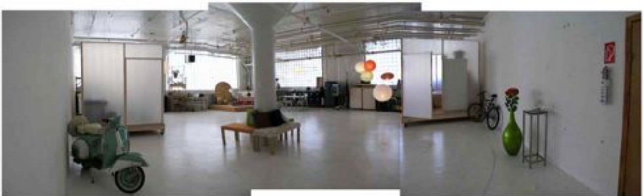
Vue de l'installation "softbox", programme de résidence, collaboration artistique