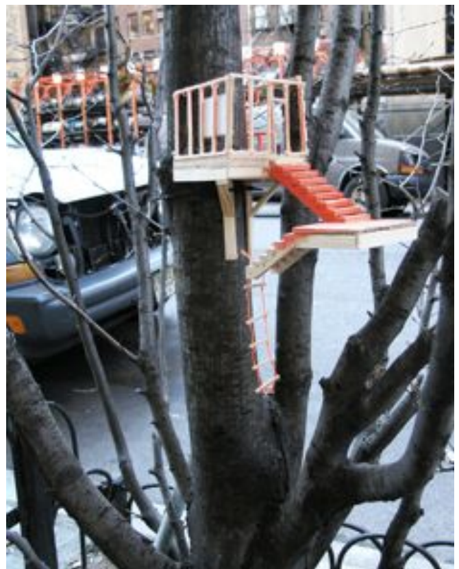
Multiplés vue de cabanes de rues - City Treehouse (sunnyside), une installation sauvage dans New York City, 2010