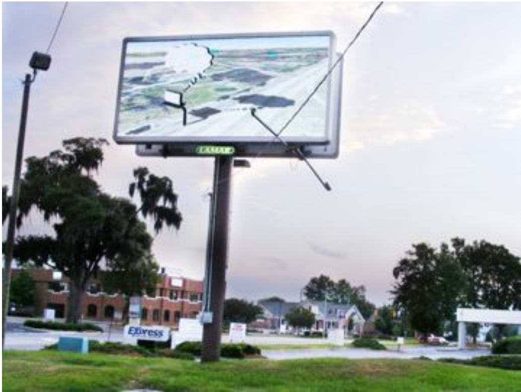
Contribution au "Billboard Art Project", Savannah, Georgia, Mai 2011