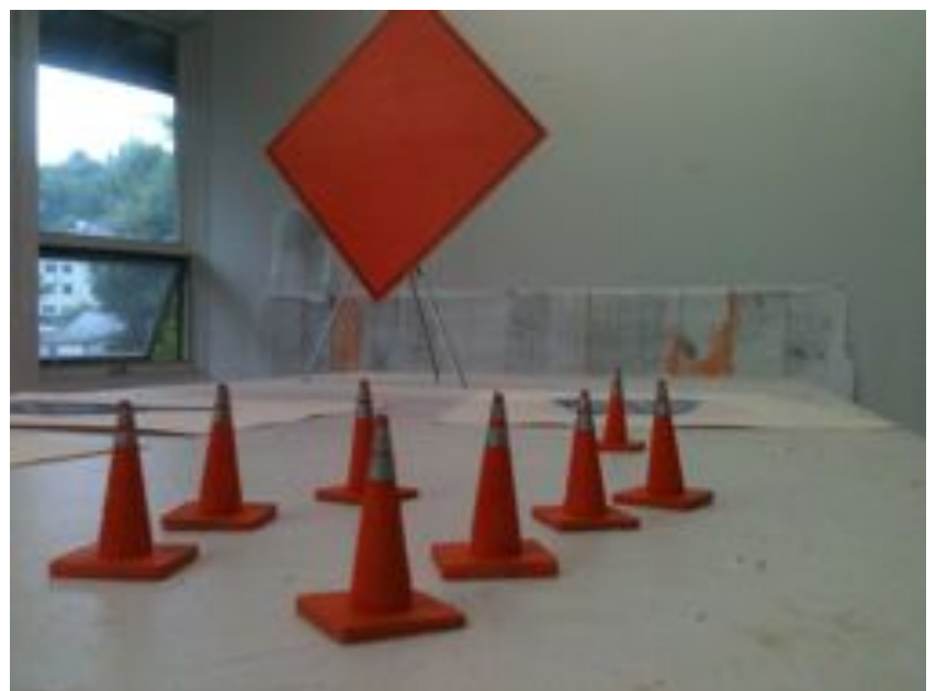
Plots de trafic miniatures et signes de circulation vides Vue d'installation, technique mixte 2011