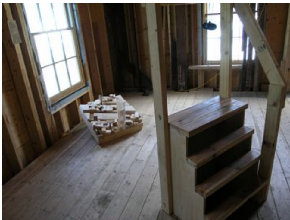
Vue d'installation du projet Wassaic: Art and Music festival, 2010.