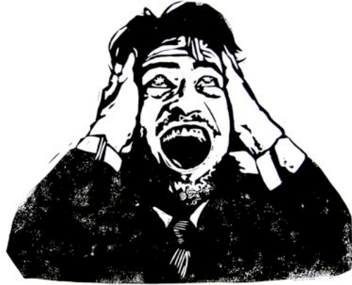
Sylvain Gelinotte, Portrait Public 02 , 2011, Encre sur papier, 70 x 50 cm