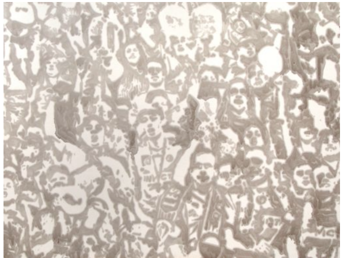
Sylvain Gelinotte, Supporters in victory , 2008, Huile de moteur sur papier, 150 X 200 cm