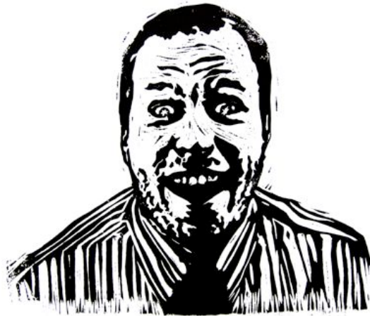
Sylvain Gelinotte, Portrait Public 03 , 2011, Encre sur papier, 70 x 50 cm