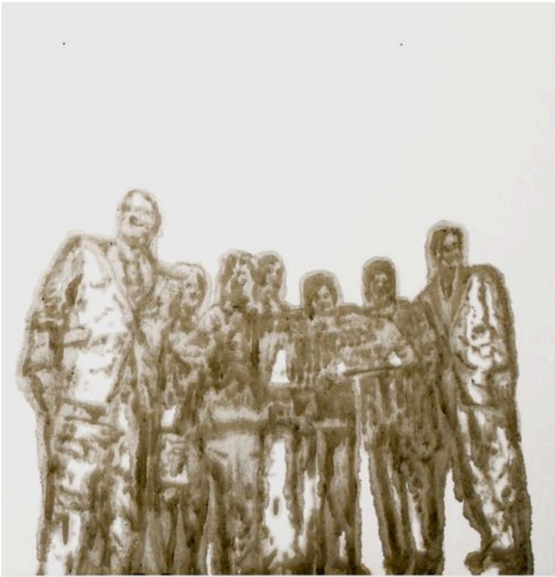
Sylvain Gelinotte, Cheque , 2008, Poussière sur papier, 150 x150 cm