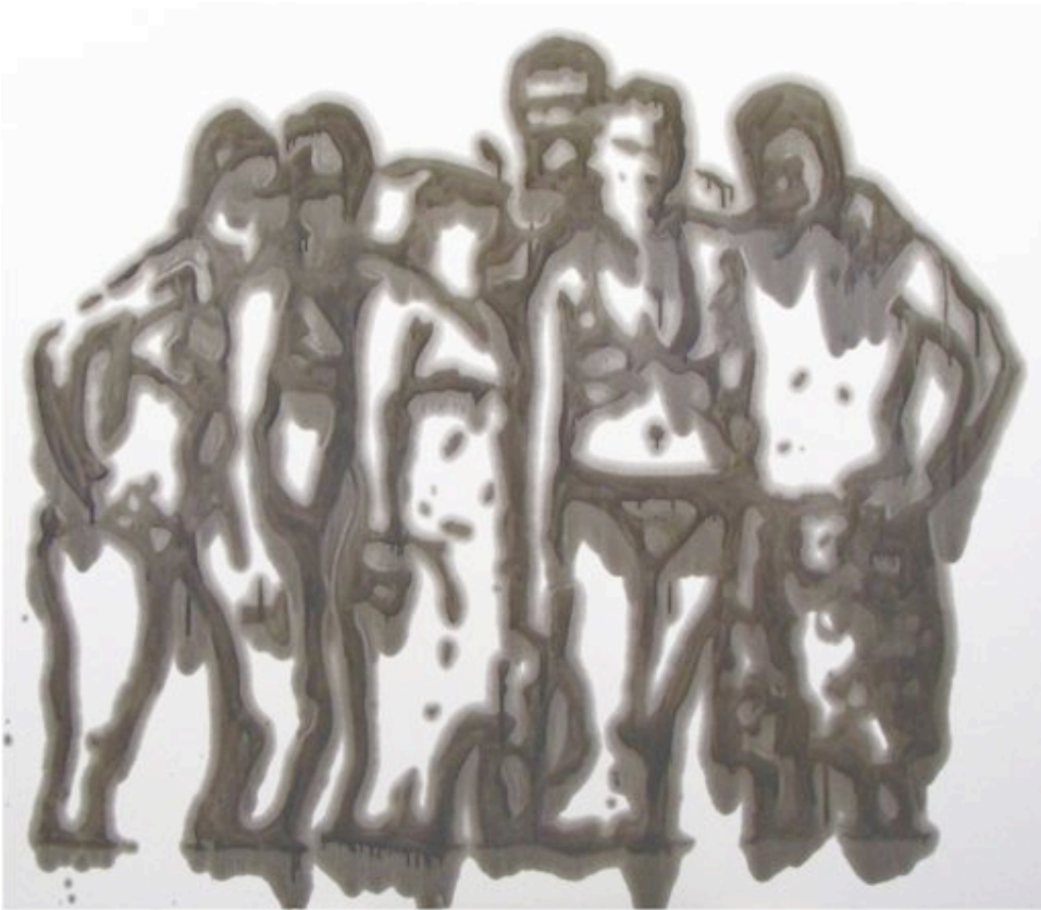
Sylvain Gelinotte, Decay – beach group , 2008, Huile de moteur sur carton plume, 171,5 x 201,5 cm