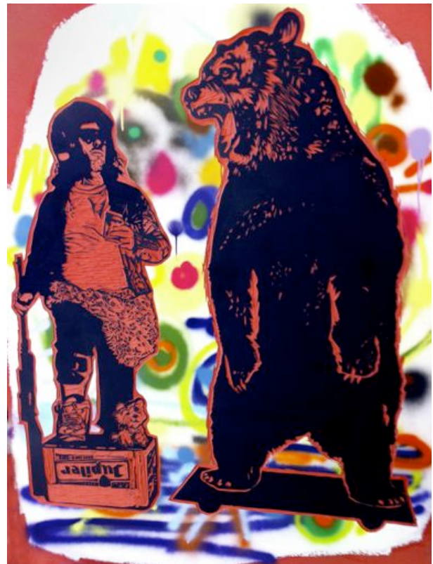
Sylvain Gelinotte, L'homme qui voulait faire peur au monde , 2011, Bois gravé, encre, acrylique, 170 X128 cm